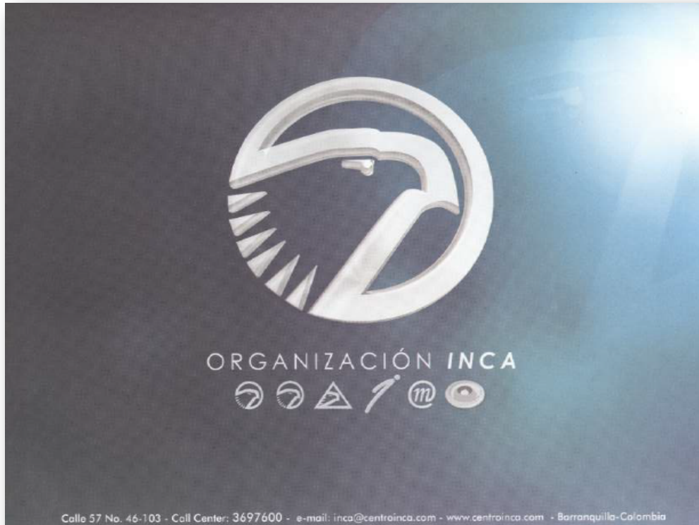
Tiro (Parte Frontal)